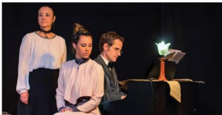
Alma d'après la nouvelle d'Anna Enquist, ce spectacle retrace le parcours d'une femme d'exception dans la Vienne du début du XX e siècle.

Information : mairie de Gières 15 rue Victor Hugo - 04 76 89 89 12 - laussy@gieres.fr www.ville-gieres.fr