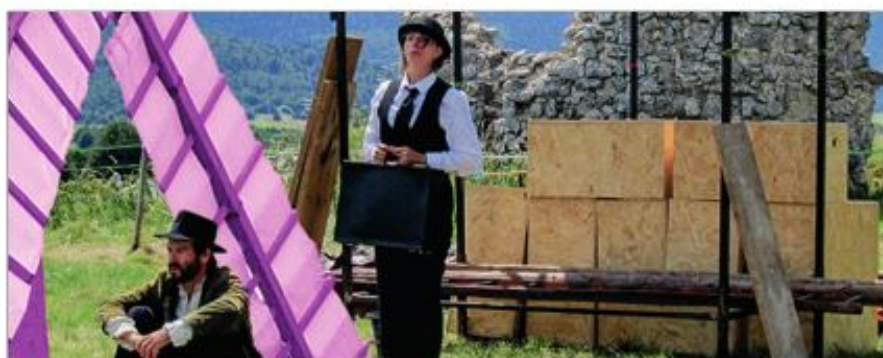
Compagnie du Nid, un spectacle qui surprendra le public.