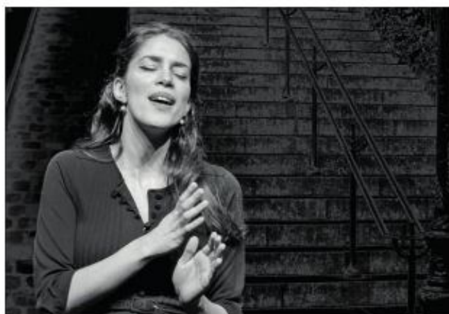
Nana de Belleville, hommage à la Journée de la femme.