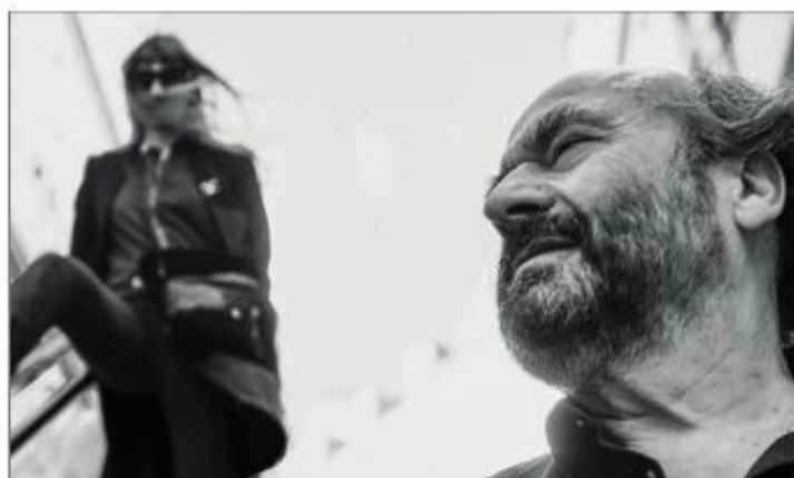
"Hugo, celui du combat", un monologue autour de Victor Hugo.